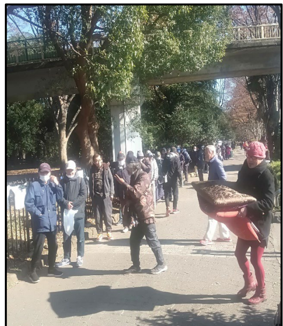
写真2-食料を受け取るホームレスの方々